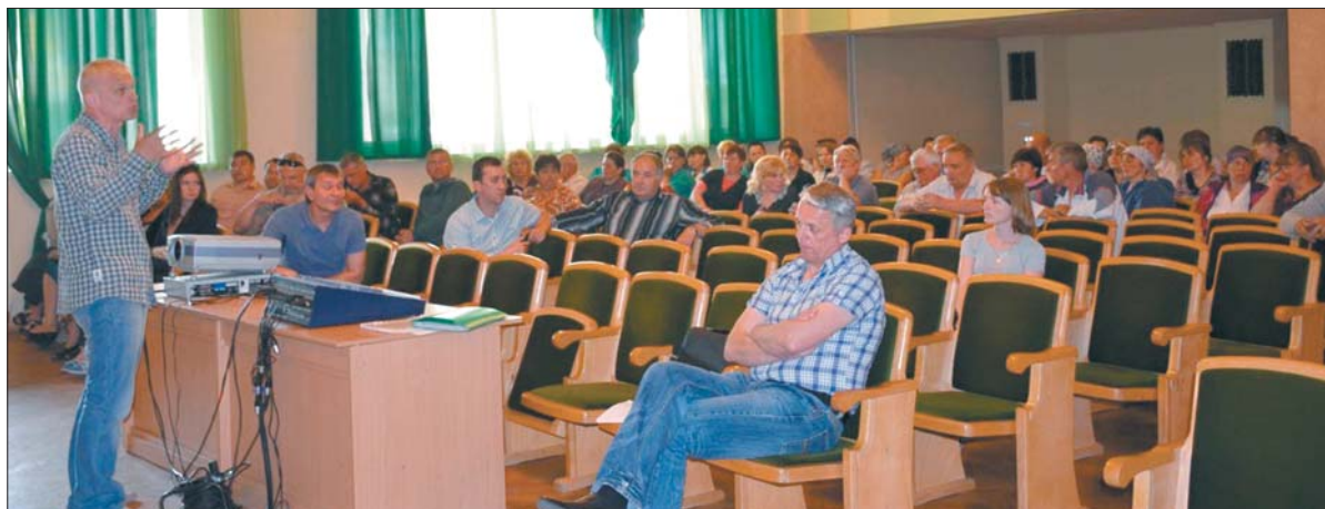
В актовому залі «Лісової пісні» зібралось понад 30 працівників санаторію. Члени громадської ради пояснили, що приїхали з метою вивчити ситуацію в закладі

Зазначимо, на сьогодні у санаторії до послуг клієнтів 408 номерів у двох корпусах. Добряча їх частина потребує капітального ремонту й оновлення матеріальної бази. Старі ліжка, що дихають на ладан, тумбочки, які ось-ось розсиплються, до того ж без ручок, обдерті. У душову взагалі не хочеться заходити: труби, крани, кабінка іржаві, боязко до чогось торкатися. Підлога 100-літньої давності. Й усе це коштує ні мало ні багато — 350–450 гривень із однієї особи. Коридори теж потребують господаря: стіни брудні, в багатьох місцях лушиться фарба. На балкон ліпше не виходити. Є загроза прова-