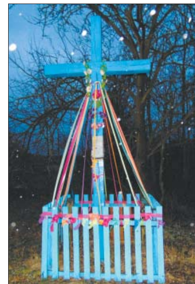
Хрест на місці загибелі жителів Кукуріків