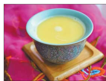
Тибетський масляний чай часуйма

рицею, мускатним горіхом і т.д. Обов'язковий інгредієнт — молоко.