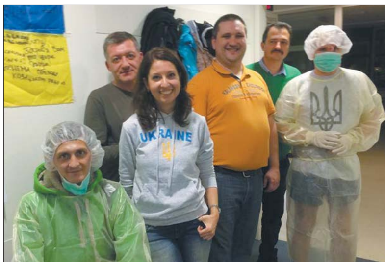
Разом із німецькими волонтерами у госпіталі

«Найперше нам упав у очі красень-джип Ford Maverick із зимо-