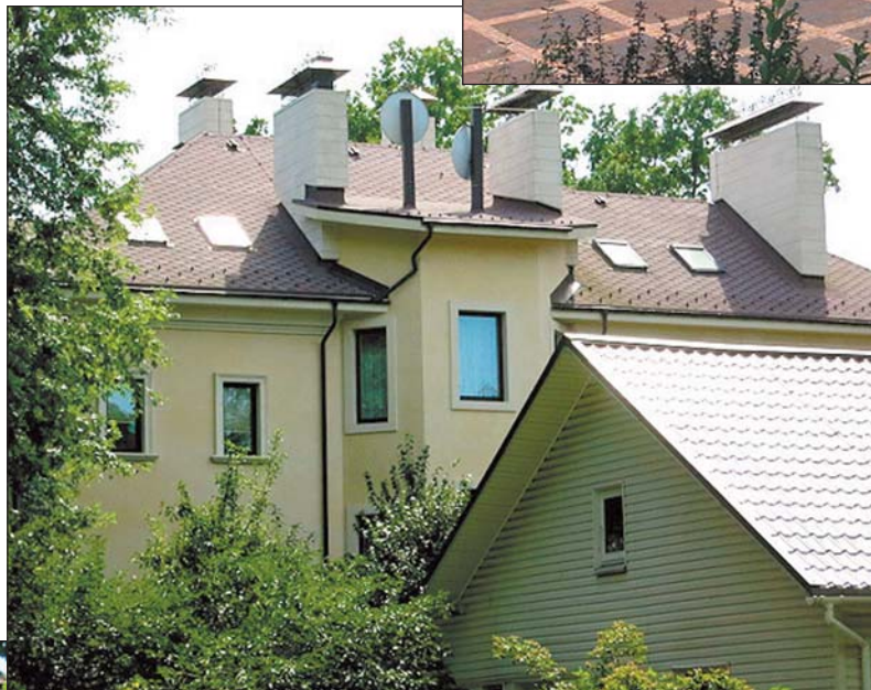
Державна дача Звягільського