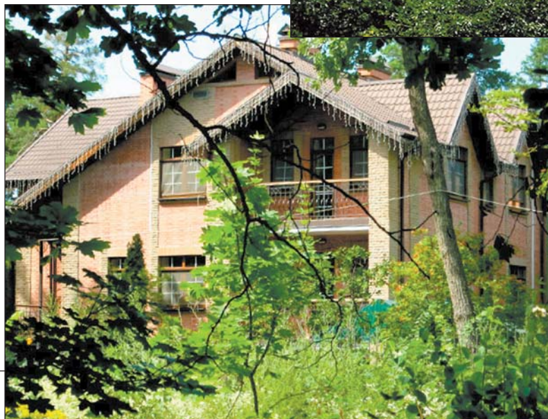
Державна дача Литвина

Це — дискредитовані діячі, частина з яких утекла за кордон, перебуваючи від правосуддя. Але на цій території досі стоять їхні дачі, часом закриті, спокій на яких береже Управління державної охорони — спецпідрозділ, який відповідає за безпеку найвищих посадових осіб держави.