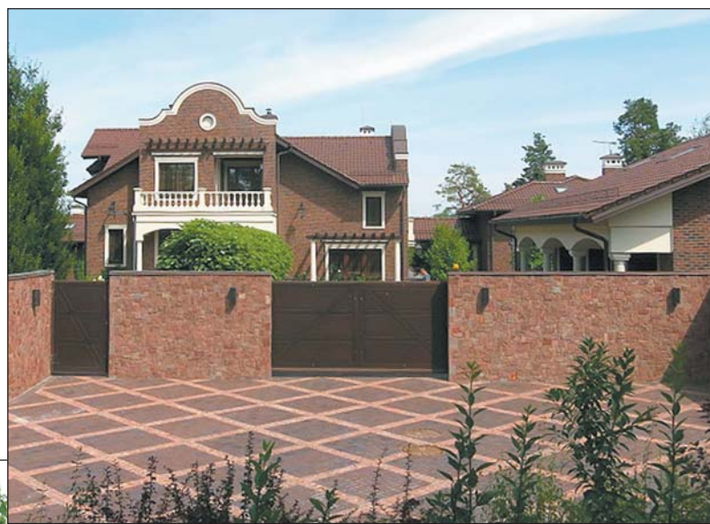
Державна дача Богатирьової

У списку мешканців люди з епохи Ющенка — экс-віце-прем'єр Васюник, колишній міністр аграрної політики Мельник, депутат Петьов-