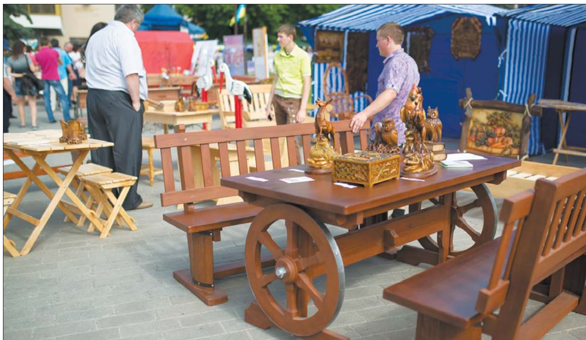
Добротні меблі, виготовлені учнями Ковельського ВПУ №5