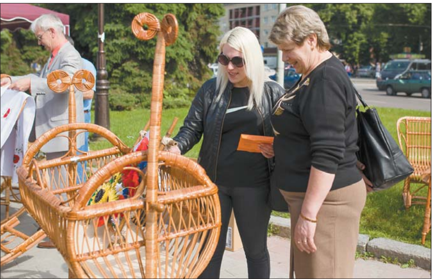
Коліска з лози викликала справжнє захоплення у лучанок

Аромат домашньої ковбаски та короваю привів до експозиції Кол-