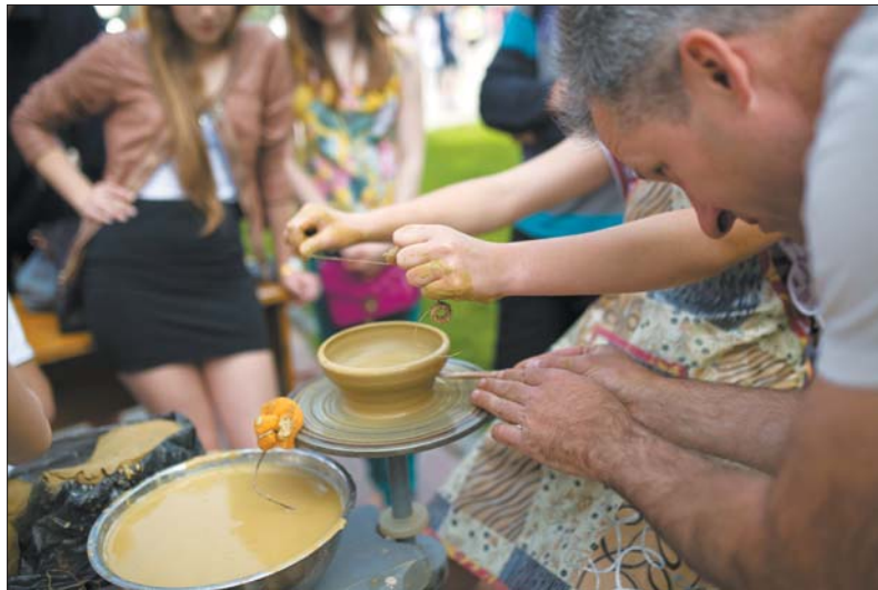
Народження глиняного посуду

Зазираємо далі — й знову творять нововолинці. Цього разу —