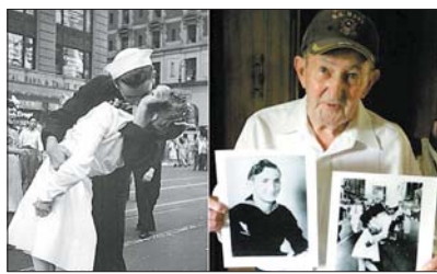
Фото зробив Альфред Ейзенш-

тадт у серпні 1945-го під час святкування перемоги на Таймс-сквер.