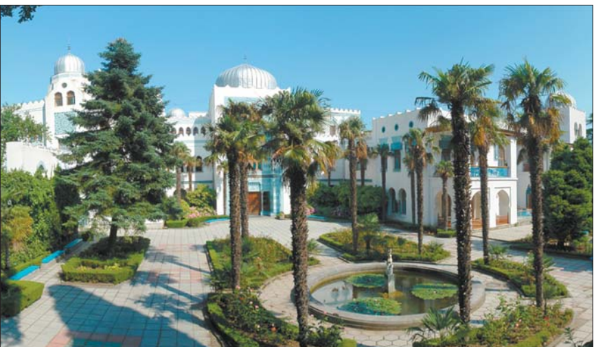
Санаторій «Дюльбер» — найпопулярніше місце для пільгового відпочинку серед усіх колишніх і чинних депутатів та їхніх помічників

У чотирьох депутатських санаторіях, які фінансують із бюджету, відпочивають переважно помічники депутатів і колишні нардепи.