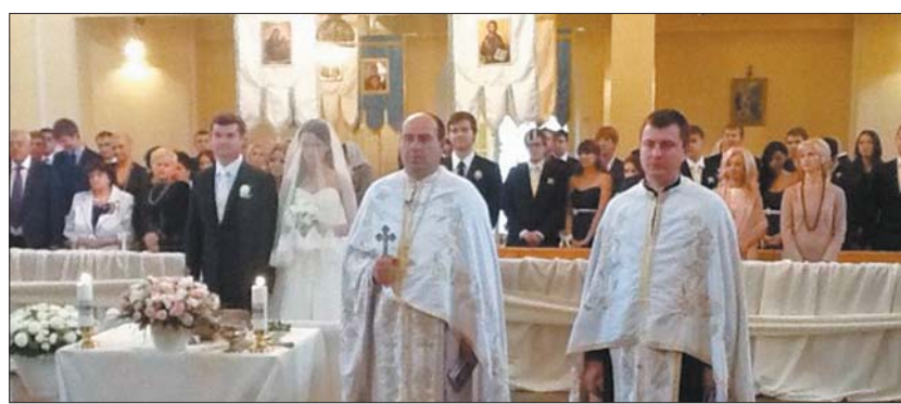
ки до дитбудинку.

На весілля молодят на їхнє прохання дарували іграшки та книги: вони планують віддати подарун-