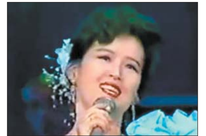
Пісня у виконанні Хен Сон Воль

Кім Чен Ін показав, як позбуватися скелетів у шафі північнокорейськи.