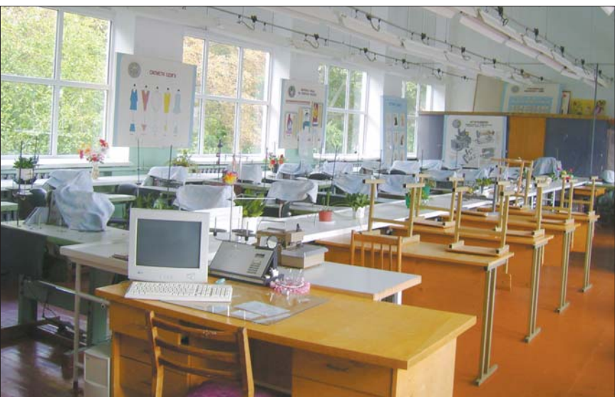
Тут навчають швейній справі

Правоохоронцю загрожує покарання у вигляді 5–10 років позбавлення волі з заборобою керувати транспортними засобами на термін до трьох років.