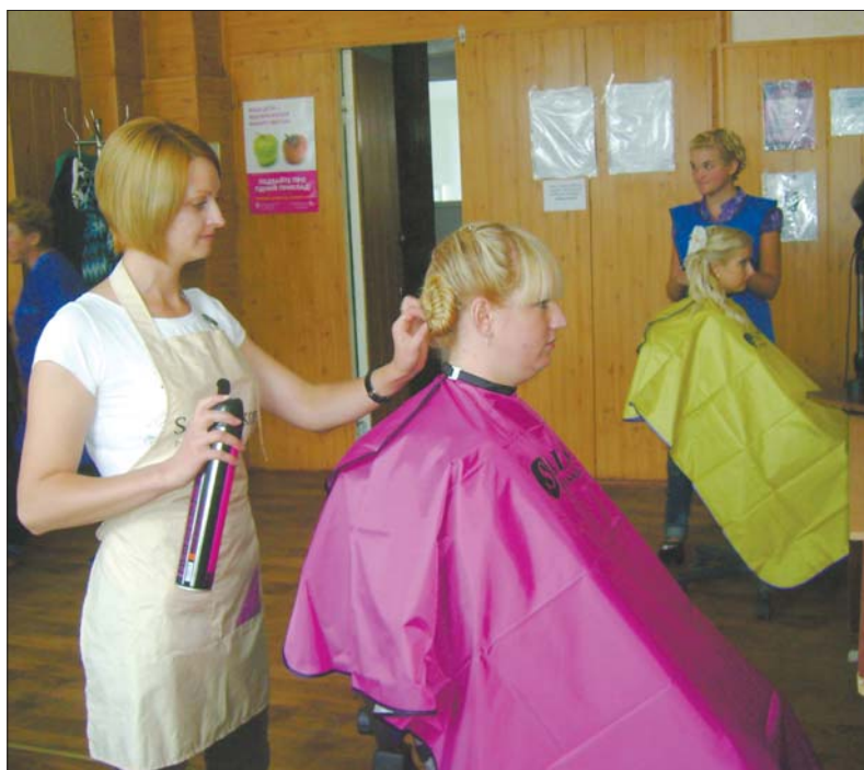
Учні здобувають спеціальність перукаря