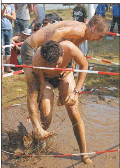
Фестери влаштували бої у багнюці