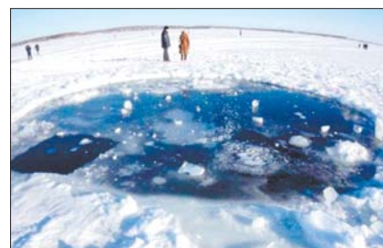
Місце падіння, озеро Чебаркуль

місці падіння метеорита, поблизу озера Чебаркуль, знайшли 53 уламки. Найбільший — 1 см у діаметрі, найменший — близько міліметра.