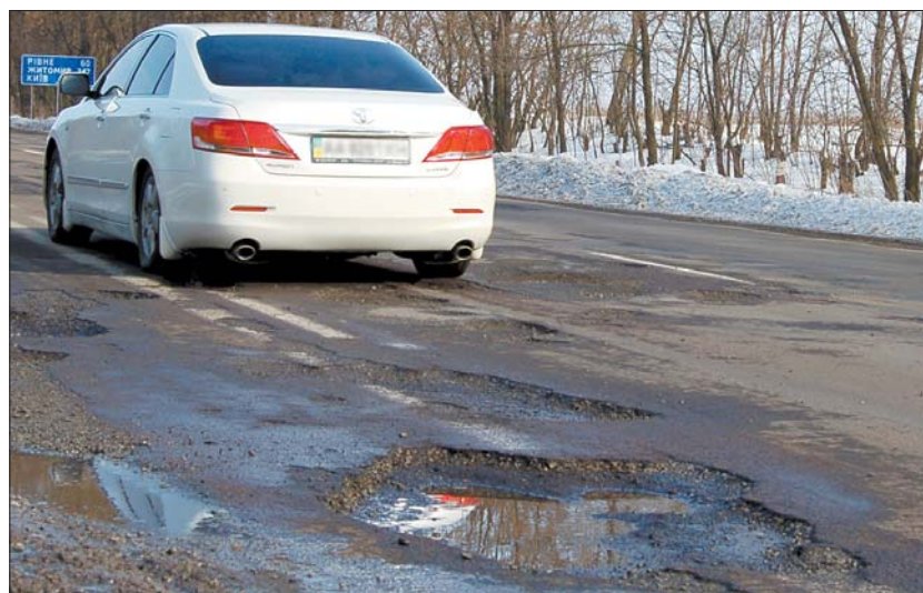
Дорога з Луцька на Рівне