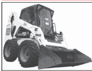
Послуги "бобкетом", розрівнювання земельних ділянок, навантажування землі, розвантажування піддонів цегли, піноблоків, бруківки. Послуги евакуатором, копаємо котловани. ☎(050) 8483994

● Сверхдлини на воду. Обслуговування. ☎(095) 5755705