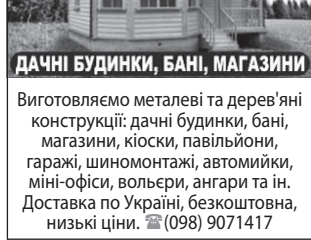
Виготовляємо металеві та дерев'яні конструкції: дачні будинки, бані, магазини, кіоски, павільйони, гаражі, шиномонтажі, автотомілки, міні-офіси, вольєри, ангари та ін. Доставка по Україні, безкоштовна, низькі ціни. ☎(098) 9071417

● ПРОДАМ. МЕТАЛОЧЕРЕПИЦЮ, ПРОФНАСТИЛ, "РУУКІ FİNNERA", "SYPER KATERAL", ПОВНА КОМПЛЕКТАЦІЯ ДАХУ. ЗАМІРИ ТА ДОСТАВКА БЕЗКОШТОВНО. ☎(098) 3586246