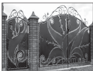
Виготовлення кованих виробів. Кузня "Файна ковка". www.fayna-kovka.prom.ua ☎(050) 2962314; (097) 6139185

● Ремонт телевізорів, встановлення кольору та звуку, заміна кінескопу, гарантія, виїзд до замовника. ☎(098) 3770120; (050) 8887903