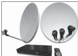
Супутникове телебачення. Продаж, гарантія, сервісне обслуговування. Послуги електрика. Продаж, монтаж кондиціонерів. ☎(0332) 285556; (066) 1980828

● Виконую дипломні, магістерські, курсові, реферати, контрольні роботи з маркетингу, менеджменту, міжнародної інформації, туризму, адміністративного, господарського права, етики, журналістики ін. гуманітарних, соціальних дисциплін. Швидко, професійно. ☎(0332) 250410; (050) 9129641; (098) 7017093