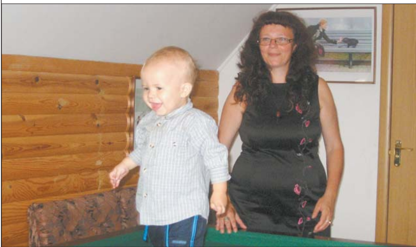
Під пильним наглядом нової мами Богданчик пуштує на бильярдному столі

Від батьків-алкоголиків вони переїхали до шикарних апартаментів