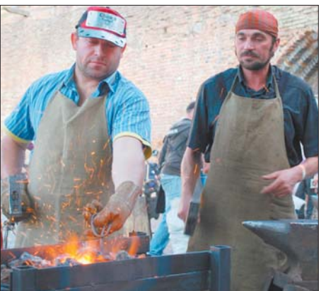
Володарі вогню і металу