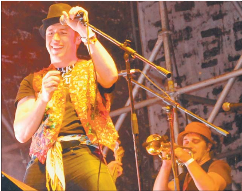
З хедлайнерами шоу організатори догодили

Арт-шоу цього року опинилося під загрозою канути в небуття, оскільки міської казни заздалегідь вистачає на обов'язкові видатки. Та, як повідомила начальник управління культури міськради і водночас автор та головний режисер-постановник