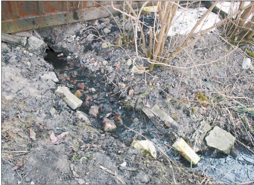
Так відводять каналізацію на Кічкарівській, 41-а

Так, у травні екологи провели низку рейдів по Стиру та його притоках: Омелянику, Сапалаївці, Жидувці. Серед таких факторів, як захащення річок деревами, знайшли й наслідки явно людської діяльності — облаштування городів у прибережній зоні, стихійні сміттезвалища та вершину людського нахабства — злив каналізаційних відходів у русло річки чи прибережну зону.