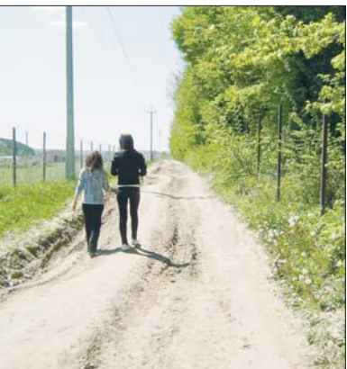
Залишилось натягти сітку — і в ліс не зайти

У південних областях 2 червня переважно ясно, опадів не очікується. Температура вночі становитиме +15...+18°C, вдень +20...+23°C. 3 червня сонячно без опадів. Уночі +15...+19°C, вдень +23...+25°C. 4 червня ясно, сухо. Нічна температура становитиме +14...+18°C, денна +25...+28°C.