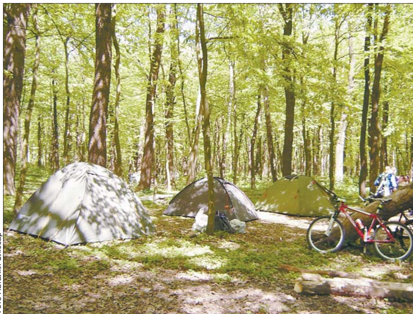
На місці наметового табору розводитимуть диких звірів