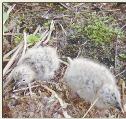
Пташенята мартина сріблястого