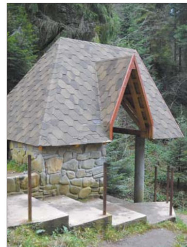
Біля одного із джерел