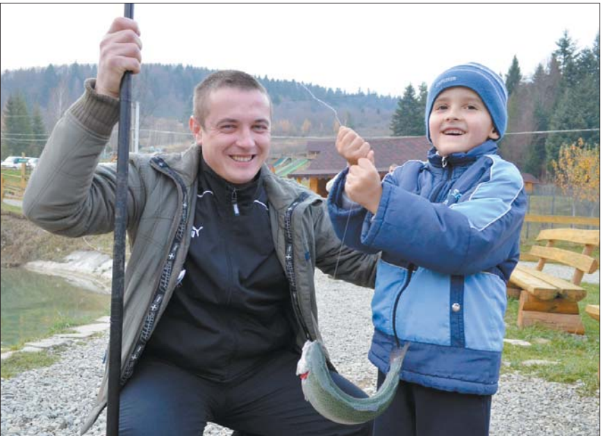
Смачна форелька на Рибнику