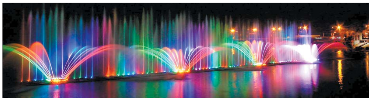
Знаменитий фонтан Roshen