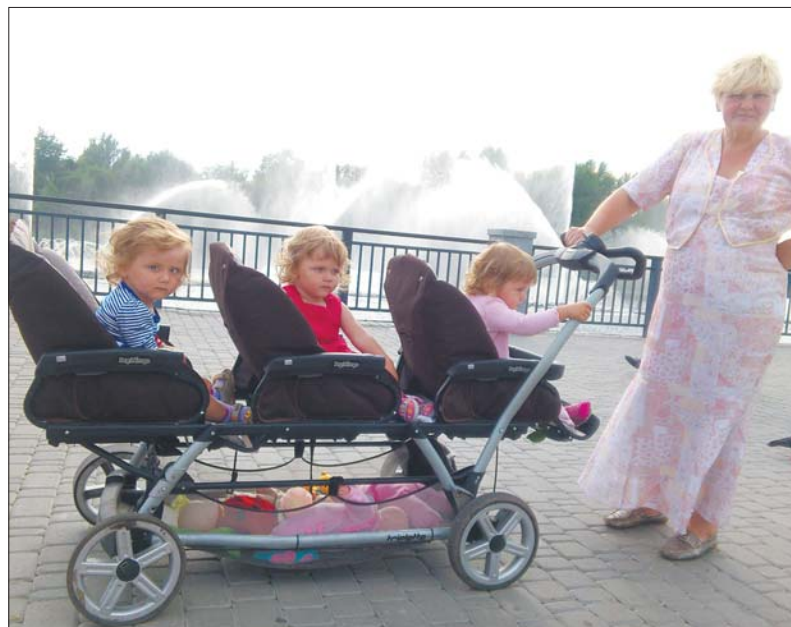
Бабуся з внуками. Коляску подарував Гройсман