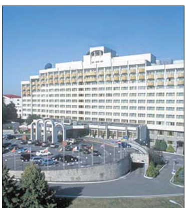
Всього в автопарку ДУС є більше

«Ми підготували для Кабміну пропозиції щодо об'єктів, які можна передати Фонду держмайна для приватизації. Ці об'єкти здебільшого збиткові: санаторії в Тернопільській області, в Кисловодську та Єсентуках (Росія), Абхазії. Також до цього списку потрапили держдачі та резиденції в Пущі-Водиці та Кончазаспі — поки що чотири об'єкти. Крім того, є транспорт, який можна реалізувати: шість літаків, два вертольоти та 150 легкових автомобі-