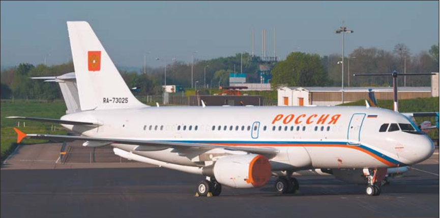
Airbus ACJ319 RA-73025 — $105 млн

Літак із ювелірним оздобленням, годинник із платини за півмільйона доларів, одна з найбільших яхт світу, броньований Mercedes за $1,6 млн — усе це належить найбагатшій людині світу — Володимиру Путіну.