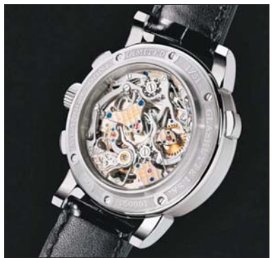
Lange & Sohne Tourbograph «Pour le Mérite»: $500 тис.

Запасний Airbus ACJ319 (RA-73025) коштує $105 млн. Дизайн салону лайнера, розрахованого на 19 пасажирів, розроблений компанією Airbus Corporate Jet Centre. У літаку є переговорна кімната на шість осіб із великим рідкокристалічним дисплеєм і засобами спеціально-