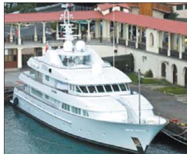
57-метрова п'ятипалубна яхта входить у сотню найкращих мегаяхт світу

Також президент «розсікає» на моторній яхті VIP-класу «Буревісник» завдовжки 27,4 та завширшки 6,5 метра. Судно водотоннажністю 87,80 тис тонн розраховане на шість пасажирів і 30 гостей, два двигуни розвивають швидкість до 22 вузлів. Салон оброблений особливим сортом чорного дерева — гондураским махагоні. Палуба оздоблена тиком. Катер був виготовлений на п'єтєрському заводі «Північна верф». Спу-