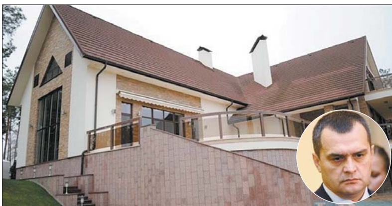
У новому будинку за високим парканом Захарченко проживав недовго