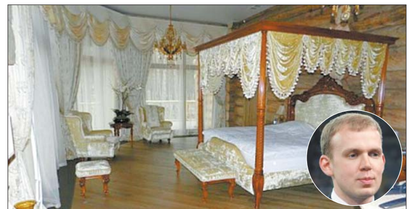
Будинок Курченка був розрахований на розваги

«Сім'я «відгризала» для себе найкрасивіші шматочки України. Така доля спіткала і сосновий бір на березі Дніпра біля Переяслава. Міс-