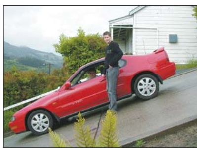
тра, що відповідає нахилу в 38 градусів.

Довжина вулиці — 359 метрів. Болдвін-стріт занесена в Книгу рекордів Гіннеса як найкрутіша жила вулиця в світі: вона піднімається на висоту майже 80 метрів. Причому її найкрутіший відрізок завдовжки 161,2 метра, а рівень підйому на ньому сягає 47,22 ме-