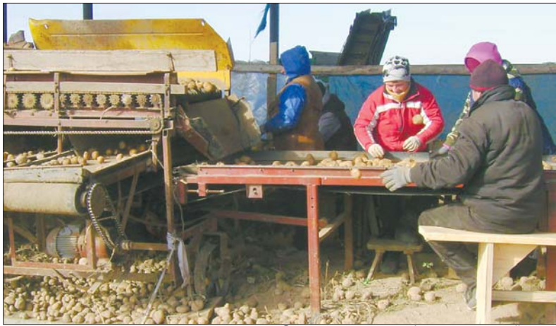
Сортування картоплі вимагає ручної праці

Село Топільне — одне з найкращих у Рожищенському районі. Тут достатньо розвинута інфраструктура і люди живуть заможніше — це видно, тільки-но потрапляеш у село: красиві великі будинки, парки, доглянуті подвір'я. А вже ще за радянських часів на території діяв колгосп ім. Ватутіна — одне з найбільших і найперспективніших господарств області. Зі слів мешканців, ті, хто працював у колгоспі, отримували дуже високі зарплати. Пам'ятають, бувало, в кінці року видавали так звану «тринадцяту», яка дорівнювала річному заробітку. І якщо інші колгоспи давно перестали існувати, майно їх розпайоване і роздане, то господарство у Топільному збережене. Правда, тепер це сільськогосподарський виробничий кооператив, де роботи мають понад 120 селян.