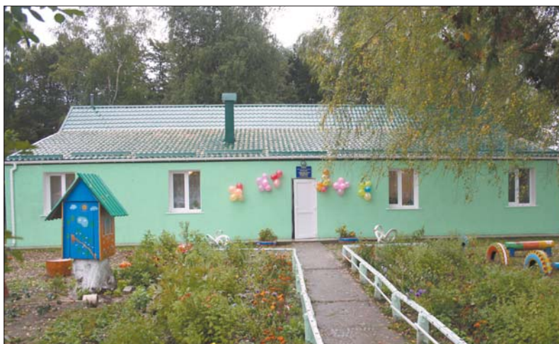
Садочок у Турійському районі

У 2012 році вперше за роки незалежності введено в дію три дитсадки-новобудови: у селах Жидичин Ківерцівського, Мельники Шацького районів та у місті Луцьку. В них загалом створено 320 місць. Відновлено роботу дошкільного закладу в селі Михлин і фактично відбудовано з фундаменту дитсадок у селі Бужани Горохівського району. Запровадили садочки у селах Нуйно Камінь-Каширського, Столинські Смоляри Любомльського та Луків Рожищенського районів. А в ДНЗ сіл Нові Червища Камінь-Каширсько-