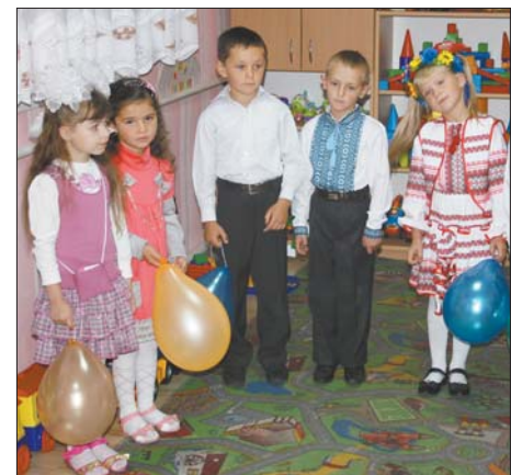
Вихованці ДНЗ Берізка с. Новий Двір Турійського району