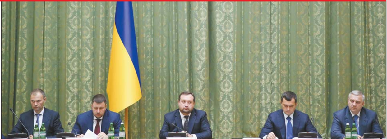
Сергій Арбузов доручив відновити діяльність регіональних антирейдерських комісій

понад стільки мільярдів штук контрабандних сигарет спожили українці за результатами І півріччя. Частка нелегальної продукції на українському ринку порівняно з минулим роком збільшилася на 84% — до 9,2%.