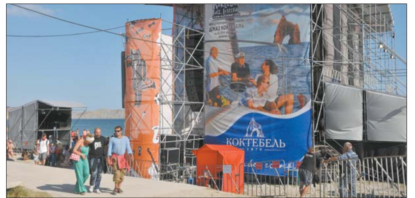
Головна фестивальна сцена Nu Jazz

Традиційно вже багато років партнером фестивалю залишається ТМ «Коктебель» — натуральні якісні коньяки та вина. Як і хороший джаз, вони близькі за настроєм, емоціями, станом душі, доповнюють