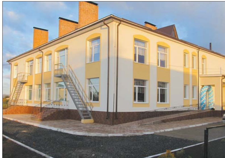
Дитячий садочок у Жидичині

дуюється медична галузь. За три роки в області модернізовано понад 40 медичних закладів різного рівня. Зокрема, торік уведено в експлуатацію два довгобуду: поліклініку в смт. Шацьк із денним стаціонаром на 20 ліжок і пунктом швидкої медичної допомоги та блок «А» Іванічівської ЦРЛ на 124 ліжка. Модернізовано обласний госпіталь для інвалідів війни. Капітально відремонтовано відділення гемодіалізу Луцької міської клінічної лікарні з територіальним розміщенням на базі Любомльської ЦРЛ, хоспісне відділення у туберкульозній лікарні с. Хотешів Камінь-Каширського району, два відділення сестринського догляду в обласній психіатричній лікарні №2, терапевтичне відділення райлікарні у Берестечку, реанімаційне та дитяче відділення у Горохівській ЦРЛ, реанімаційне відділення у Луцькій ЦРЛ, після капітального ремонту відкрито амбулаторію загальної практики — сімейної медицини у селі Павлівка Іванічівського району. Триває реконструкція при-