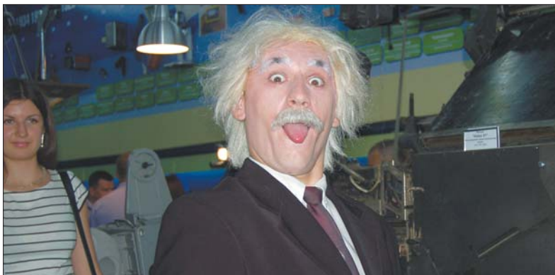
Гостей музею зустрічав та роздавав подарунки двійник Ейнштейна

Цікаво, що все освітлення в музеї виготовлене за світлодіодною технологією, що відповідає сучас-