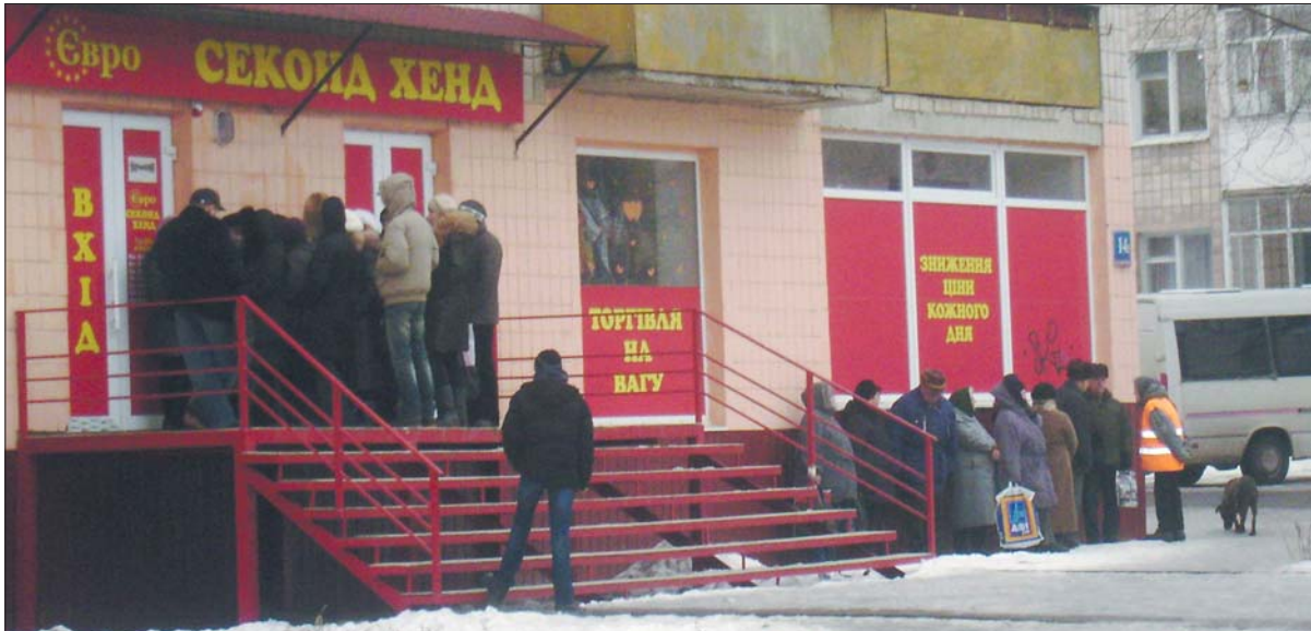
Черга за секонд-хендом за 40 хвилин до відкриття магазину

Люди вдягаються на секонд-хенді не тому, що їм так хочеться, а тому, що більшого не можуть собі дозволити. А вже сьогодні левову частину доходів «з'їдають» комунальні платежі та харчі. На одяг грошей практично не залишається. Така думка звучала у більшості покупців, із якими вдалося поговорити у ма-