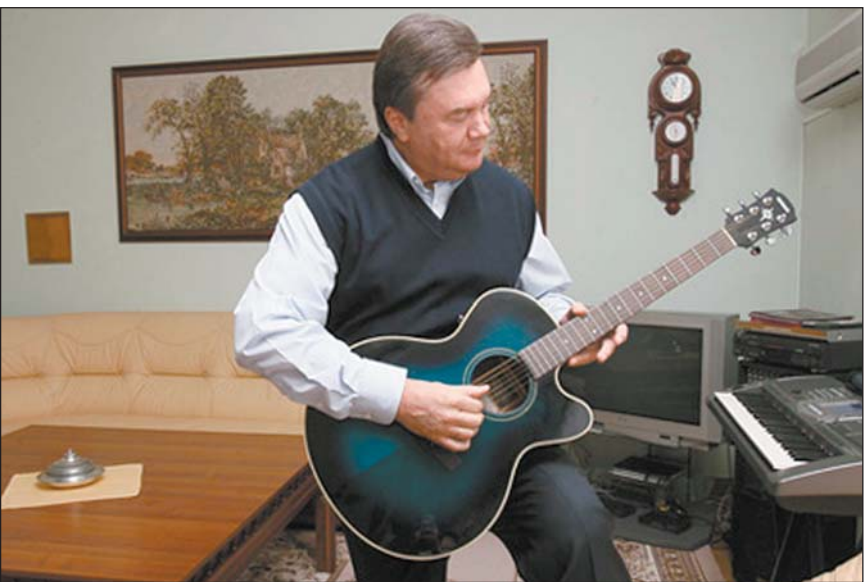
Віктор Янукович не часто показує, де він живе

Повідомлення з проханням внести суму за «зайві» квадратні метри почнуть приходити поштою вже з 15 квітня. Закон про податок на нерухомість був прийнятий минулого літа. Його творці запевняють, що пересічного населення нововведення не торкнеться: за понаднормові «квадрати» житлової площі платитимуть тільки багаті. Ось про них, політиків і бізнесменів, ми й вирішили дізнатися — скільки грошей вони викладатимуть за розкіш мешкати в гігантських квартирах і маєтках. Інформація про нерухомість узятя з декларацій політиків і чиновників за 2011-2012 роки.