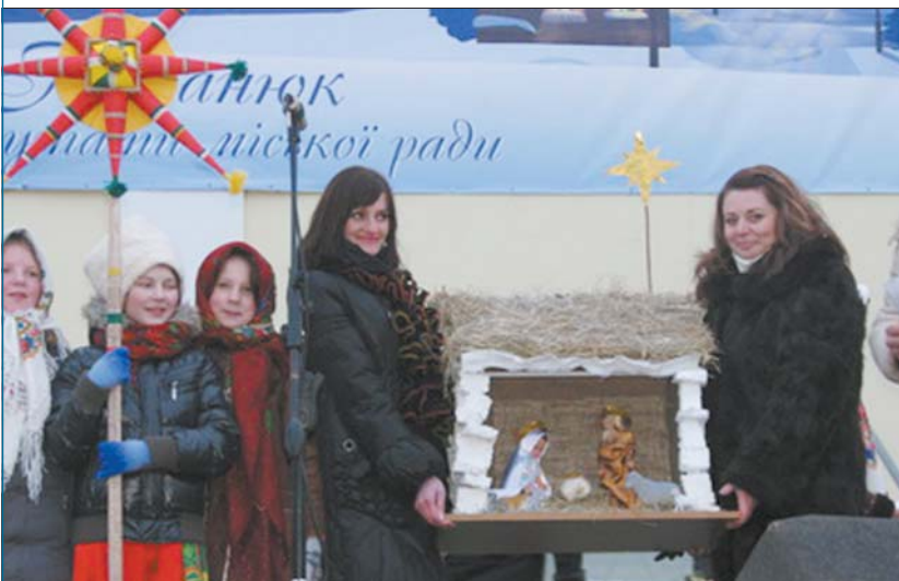
Шопка-переможець конкурсу різдвяної атрибутики

Опанасівну в найближчу лікарню, де і з'ясувалося, що у неї переломи. Через травми Светличній доведеться скасувати прем'єру вистави в Краснодарі.