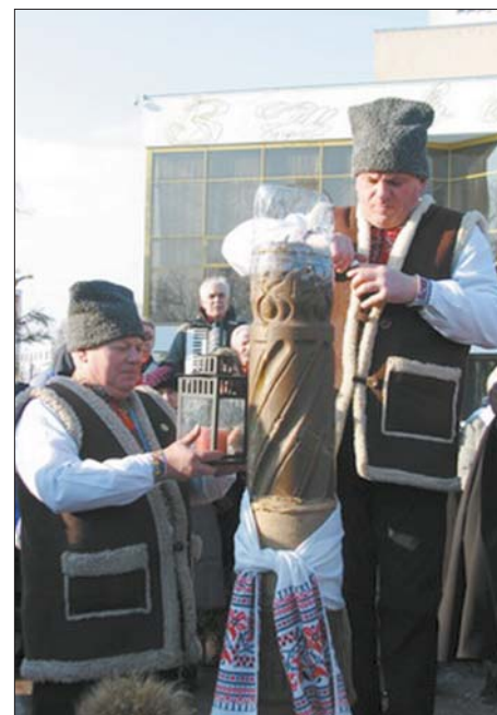
Запалення різдвяної свічі