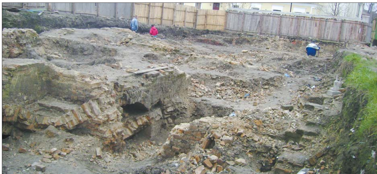
Ці підземелля виявили археологи