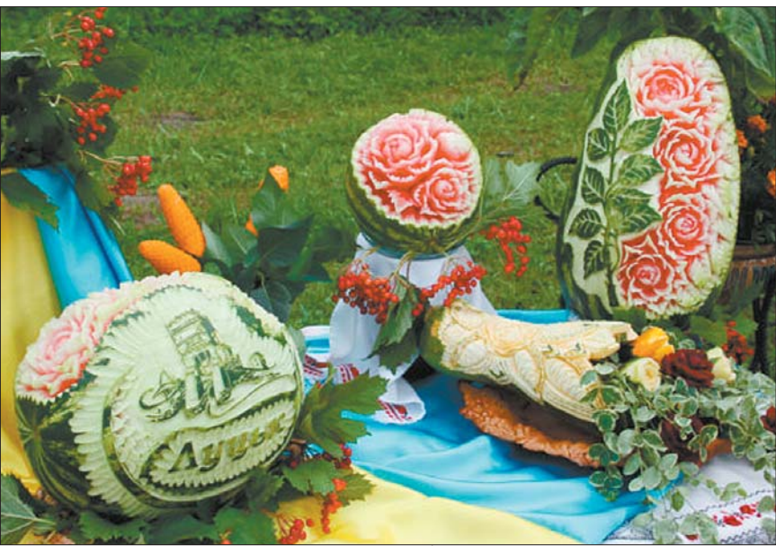
Презентація робіт Ольги Гончарук на Святі квітів у Луцьку

стигають овочі-фрукти, з яких можна різьбити.