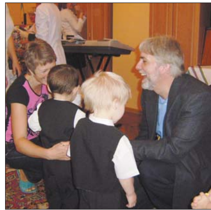
Американська сім'я — часті гості у Будинку дитини