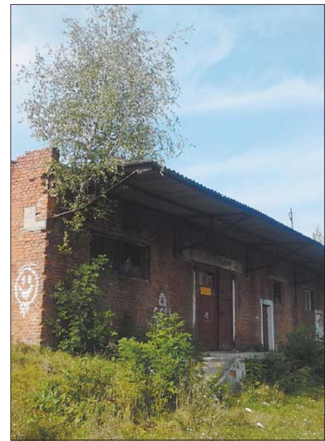
Береза проросла із приміщення військового містечка