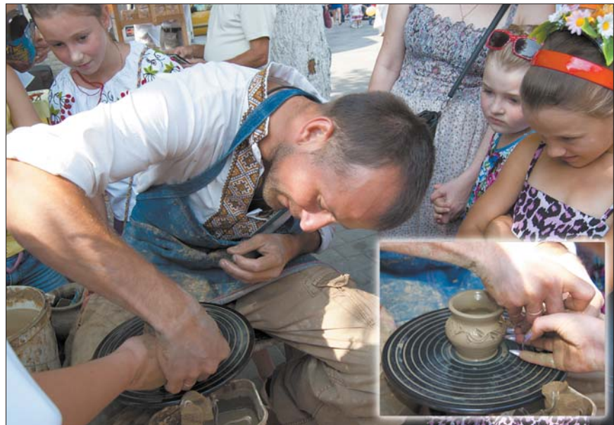
Майстер-клас від народного умільця

тецька вулиця», де розмістився ярмарок декоративно-прикладного та