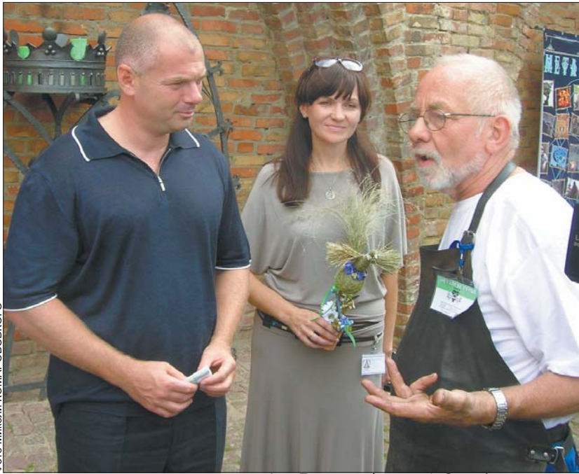
Ігор Палиця на фестивалі «Солом'яна птаха»

Коли він проходив алеєю парку, аби оглянути квіткові шедеври від місцевих організацій і підприємств, люди щоразу зупиняли кандидата у народні депутати, щоб привітати зі святом і подякувати за добрі справи. Особливо зворушливою була