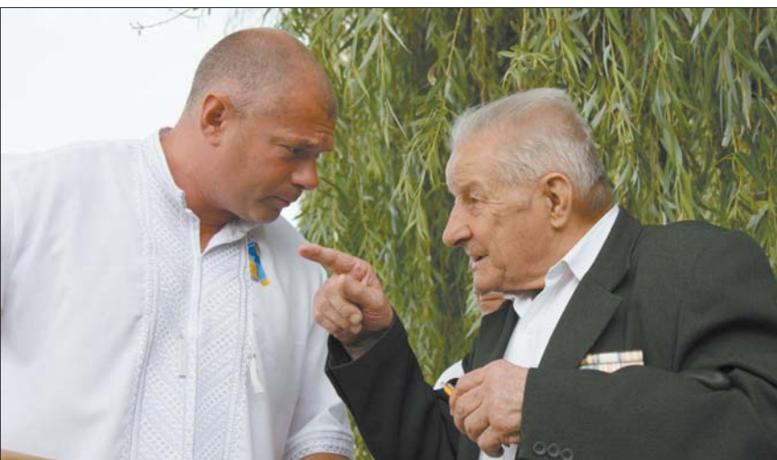
Розмова з ветераном