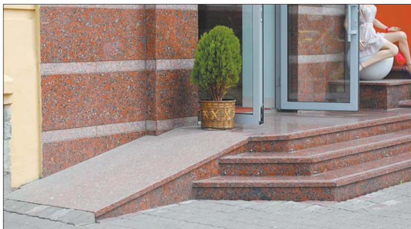
Пандус перегородили вазоном

Життя неповносправних людей у нашій країні складається з безперервної вервечки проблем і перешкод. Можна довго говорити про недостатнє соціальне забезпечення, а можна просто уявити один день із життя людини на інвалідному візку. Чи може неповносправний самостійно і безперешкодно пересуватися нашим містом, зайти в магазин, аптеку, кав'ярню чи бібліотеку? Наскільки Луцьк пристосований для таких людей?