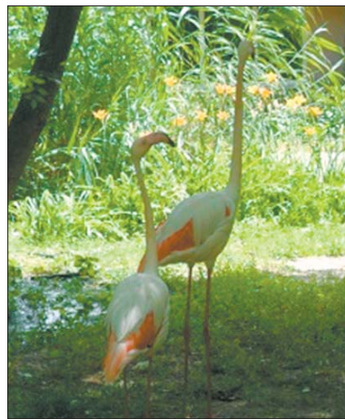
У Миколаївському зоопарку

Крім зоопарку, мене вразили білборди. Мушу сказати, що неприємно вразили. Це були білборди на захист російської мови, з таким текстом, що, мовляв, нас, російськомовних, 780 тисяч, тож чи потрібна нам російська мова? До слова, таких білбордів ні в Одесі, ні в Очакові я не бачила.