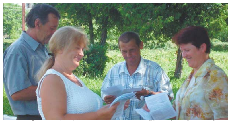
Громадські помічники працюють на території Іваничівської селищної ради

У центрах зайнятості спільно з Волинським інститутом підтримки та розвитку громадських ініціатив