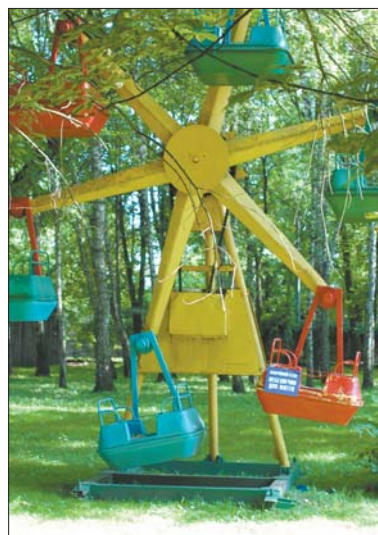
Небезпечні атракціони на території зоопарку

Чільник зоопарку пригадав лише те, що не так давно трьох левенят виміняли на дві самиці лам, одну з яких звіринцю іще не отримав, та одного ослика. А одна з лам