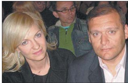
Михайло Добкін з дружиною Аллою

міна, дохід сім'ї складає 6,074 мільйона; Алла Добкіна, співвласниця харківської телекомпанії «7 канал» і дружина голови Харківської ОДА Михайла Добкіна, дохід сім'ї складає 5,046 мільйона гривень; Світлана Колеснікова, домогосподарка, дружина віцепрем'єр-міністра — міністра інфраструктури Бориса Колеснікова, дохід сім'ї складає 3,576 мільйона гривень; Олена Пеклушенко, дружина губернатора Запорізької області Олександра Пеклушенка, дохід сім'ї складає 2,413 мільйона