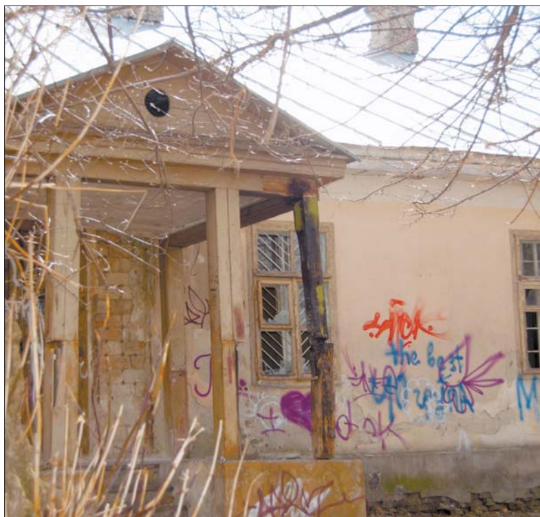
На місці цієї будівлі є намір збудувати готель

Щоправда, один готель у Старому місті вже обіцяли: його мали звести на вулиці Плитниці. Йдеться про колишній шляхетський будинок XIX століття, який уже давно знаходиться у приватній власності. Як стало відомо, спочатку підприємець думав зробити там готель, однак до