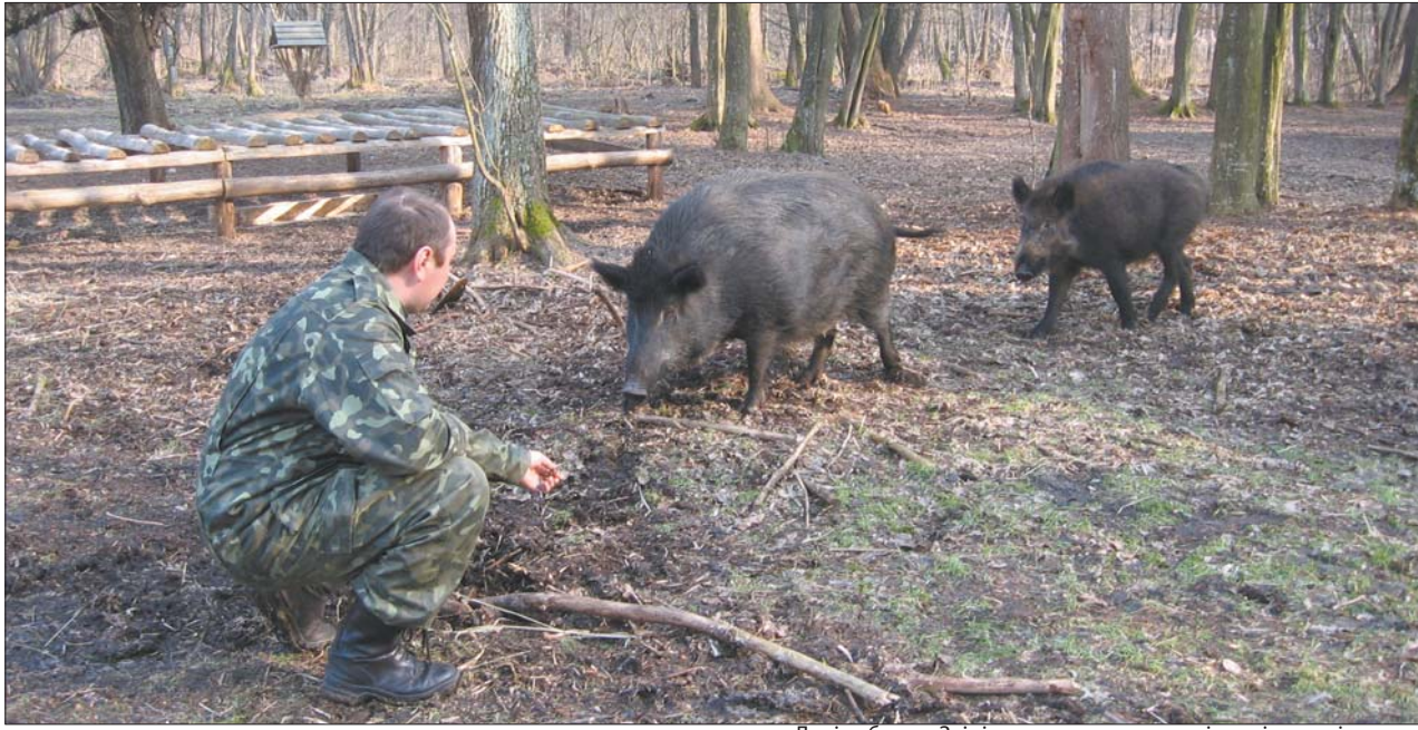
Дикі кабани у Звірівському господарстві зовсім ручні