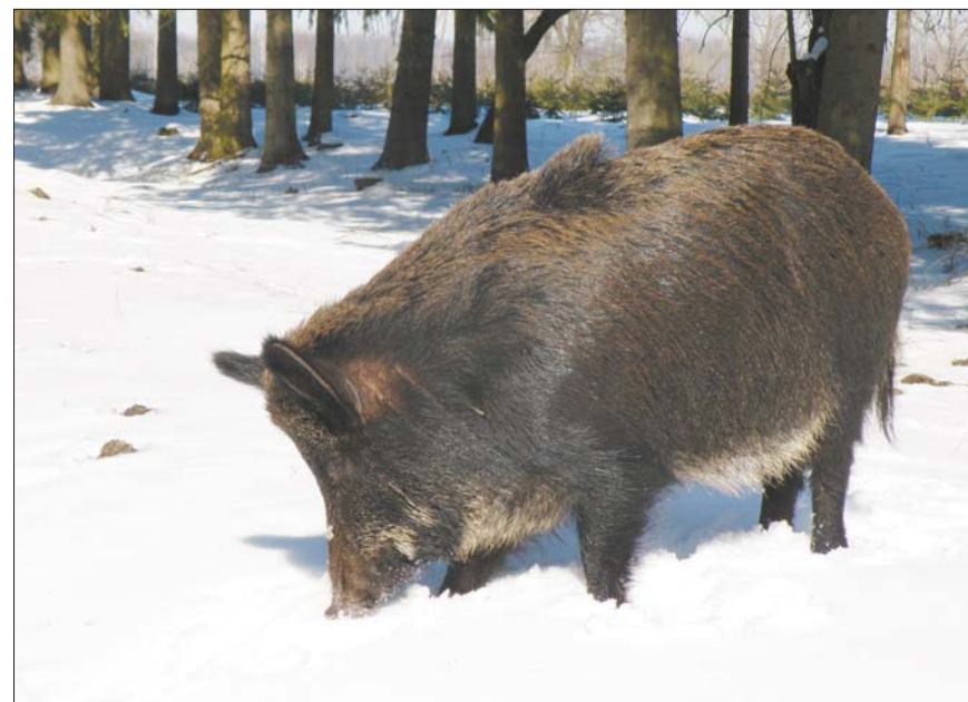
Водиться у маневицьких лісах і дикий кабан

Прибувши до місця базування охорони Софіянівських угідь, знайомимось з егерями. Щоденно на угіддях площею майже 19 тисяч гектарів патрулює по дві машини. Періодично егері виїжджають у рейд на чотириох-п'ятьох автівках. На снігу