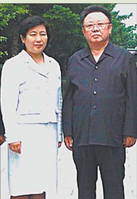
Остання любов диктатора Кім Ок

Наприкінці 2011 року в Північній Кореї попрощалися з Кім Чен Іром. В очі світової спільноти диктатор виглядав неприсутнім деспотом, який усе вирішував одноосібно. Втім, як пишуть журналісти «Los Angeles Times», це не зовсім так. «Улюблений керівник», як виявилось, дослухався до порад своїх дружин і коханок.