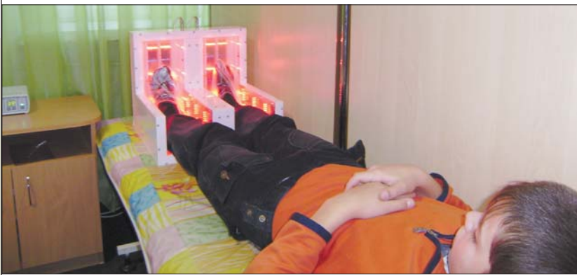
Фотонна камера допомагає при захворюваннях нижніх кінцівок

Мають у санаторії власну пасіку, самі заготовляють лікарські трави. З них потім готують лікувальні чаї та настоянки.