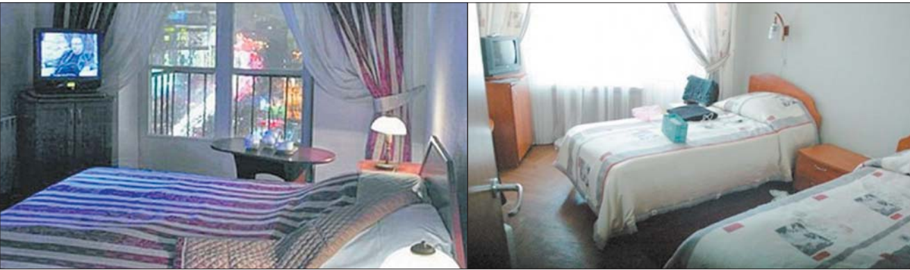
У таких номерах живуть народні обранці