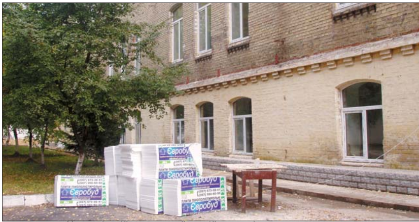
У грудні в цій реконструйованій казармі вже житимуть прикордонники

До кінця року в Луцьку прикордонники святкуватимуть новосілля — у грудні заплановано здати 45 квартир службового житла. На території військової частини, де розміщений Луцький прикордонний загін, триває реконструкція колишніх гусарських казарм. У триповерховому приміщенні XVIII століття добротні кімнати з чотириметровою стелею перетворюють на сучасні квартири. Комфорт будівельники гарантують: як то кажуть, вселяйся і живи. При цьому середня вартість одного квадратного метра тут не перевищить 3500-3600 гривень, тоді як на ринку нерухомості Луцька ціна «квадрата» житлоплощі стартує з шести тисяч. Загалом на реконструкцію казарми виділили понад дев'ять мільйонів гривень. Оглянути хід робіт, які вже вийшли на фінішну пряму, приїхав голова Державної прикордонної служби України, генерал армії Микола Литвин.